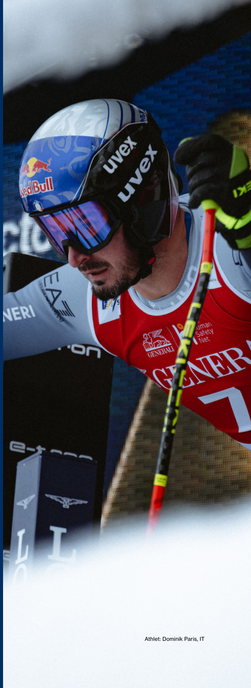
Athlet: Dominik Paris, IT

Aus Gründen der besseren Lesbarkeit wird bei Personenbezeichnungen und personenbezogenen Hauptwörtern in diesem Katalog die männliche Form verwendet. Entsprechende Begriffe gelten im Sinne der Gleichbehandlung grundsätzlich für alle Geschlechter. Die verkürzte Sprachform hat nur redaktionelle Gründe und beinhaltet keine Wertung.