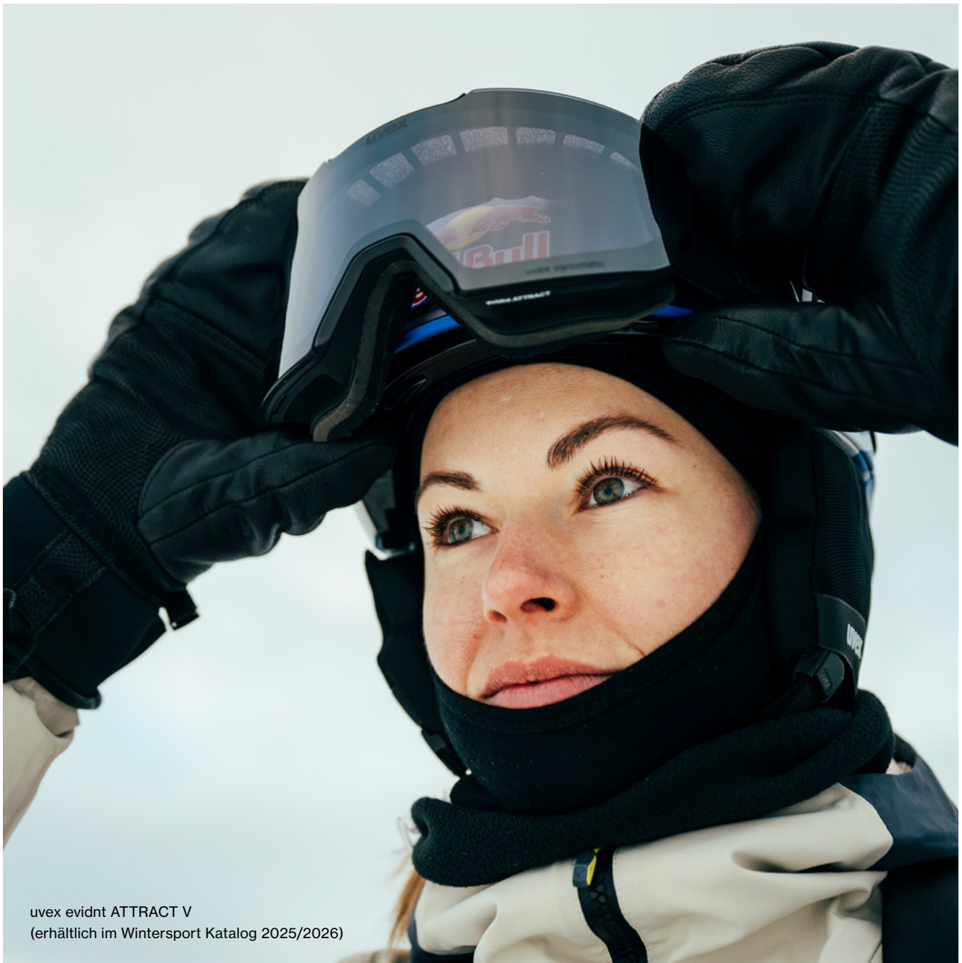
uvex evidnt ATTRACT V (erhältlich im Wintersport Katalog 2025/2026)